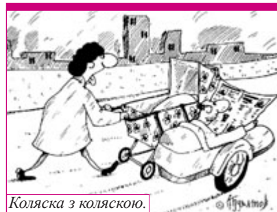
Коляска з коляскою.

урахуванням специфіки самої Асоціації. А вона полягає в тому, що ми уникаємо мітингових методів боротьби за права літніх людей (в тому числі і жінок), прагнемо залучати професіоналів до розробки наших проєктів. Лише конструктивні, зважені, професійно зрілі пропозиції є запорукою успіху. Ми повинні мати в державі Закон про захист прав пенсіонерів, Закон про гендерну рівність, ряд інших законів, і ми залучаємо до розробки законопроектів учених, політиків, економістів, у тому числі жінок.