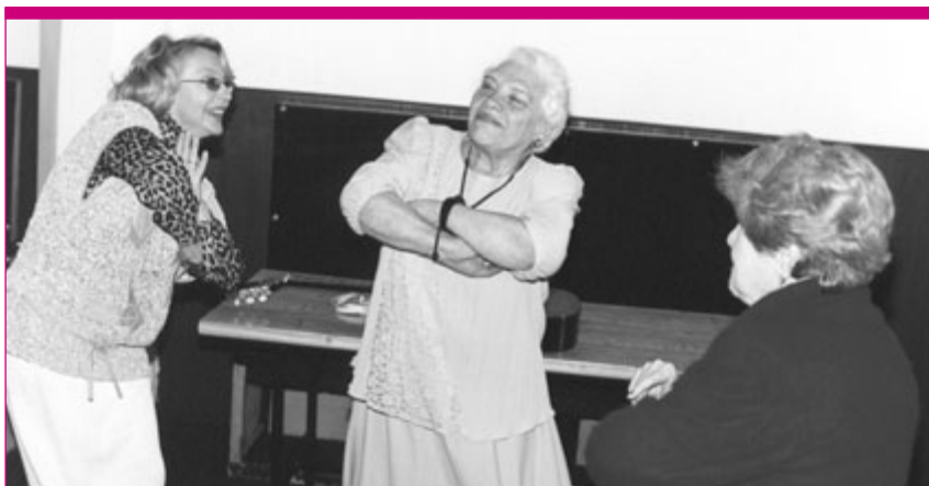
Ми ще й молодих перетанцюємо!.. Під час святкування дня людей похилого віку в Одеському регіональному відділенні ВАП.