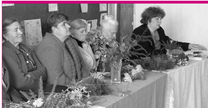
Урок, присвячений Міжнародному дню людей похилого віку в Радивилівській середній школі № 1 (м. Радивилів Рівненської області).

У № 3 журналу Всеукраїнської асоціації пенсіонерів "Наше покоління" за 2002 рік була надрукована інформація "Радивилівські уроки", що розповіла про акцію "Діалог поколінь", започатковану Рівненським регіональним відділенням ВАП спільно з зацікавленими організаціями та установами. Мета акції - активне сприяння гармонізації відносин між