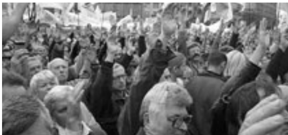
Продовження. Початок на 1-й стор.

Більше того – навіть Верховна Рада, вищий законодавчий орган України, всупереч Конституції, попри норми міжнародного права, узаконує акти, які є порушенням прав людини. Прикладом може бути, скажімо, Закон про державну службу в Україні, згідно з яким права літніх людей обмежено за віковим цензом.