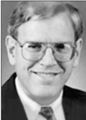
Стівен ПАЙФЕР, колишній Посол США в Україні:

„Я вражений тим, чого досягла Ваша Асоціація!”