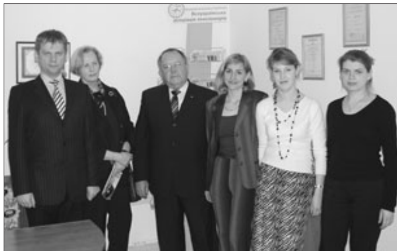
Президент Європейського союзу пенсіонерів Бернхард Вормс і генеральний секретар ЄСП Інгеборн Улленброк у Радивилівському відділенні ПВКС.

ках якої були організовані й проведені такі заходи, як виїзний спектакль столичного театру „Срібний острів” у Радивиліві, акції „Родзинка”, „Бал бабусь”, „Вітання від Святого Миколая”.