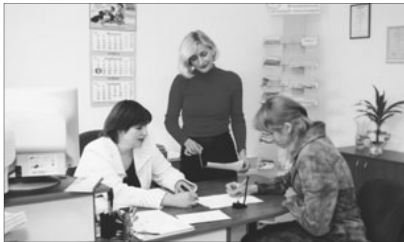
У ПВКС кожному члену спілки – максимальна увага.

Кредитна спілка планує й надалі розширювати програму фінансових послуг членам ВАП. Здійснено навчання й сертифікацію голови Правління та головного бухгалтера відповідно до вимог державного регулятора. Було також упроваджено Культурну програму для членів ПВКС і ВАП, у рам-