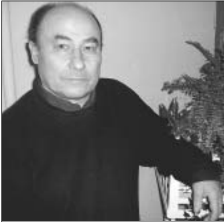
Слова і музика Євгена Черевченка