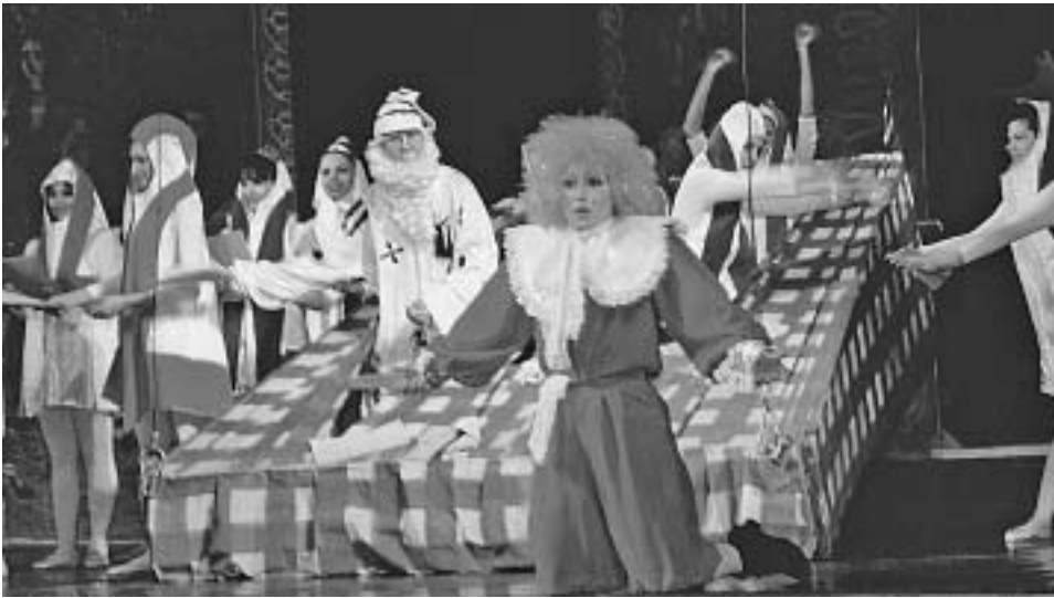
Під час спектаклю Київського державного академічного музичного театру для дітей та юнацтва, який одним з перших відгукнувся на пропозицію ВАП про співпрацю в Культурній програмі.