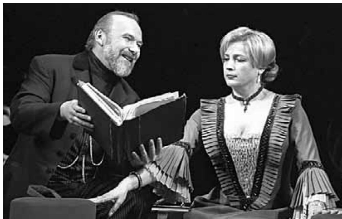
Національному академічному театру російської драми імені Лесі Українки виповнилося 80 років. Рада Всеукраїнської асоціації пенсіонерів і редакція газети "50 плюс" щиро вітають творчий колектив театру з ювілеєм і бажають йому нових успіхів у розвитку театрального мистецтва! На знімку: сцена із спектаклю за п'єсою О. Островського "Вовки та вівці".